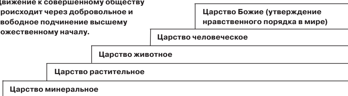
Схема 3. Д.Белл

Движение к совершенному обществу происходит через добровольное и свободное подчинение высшему божественному началу.